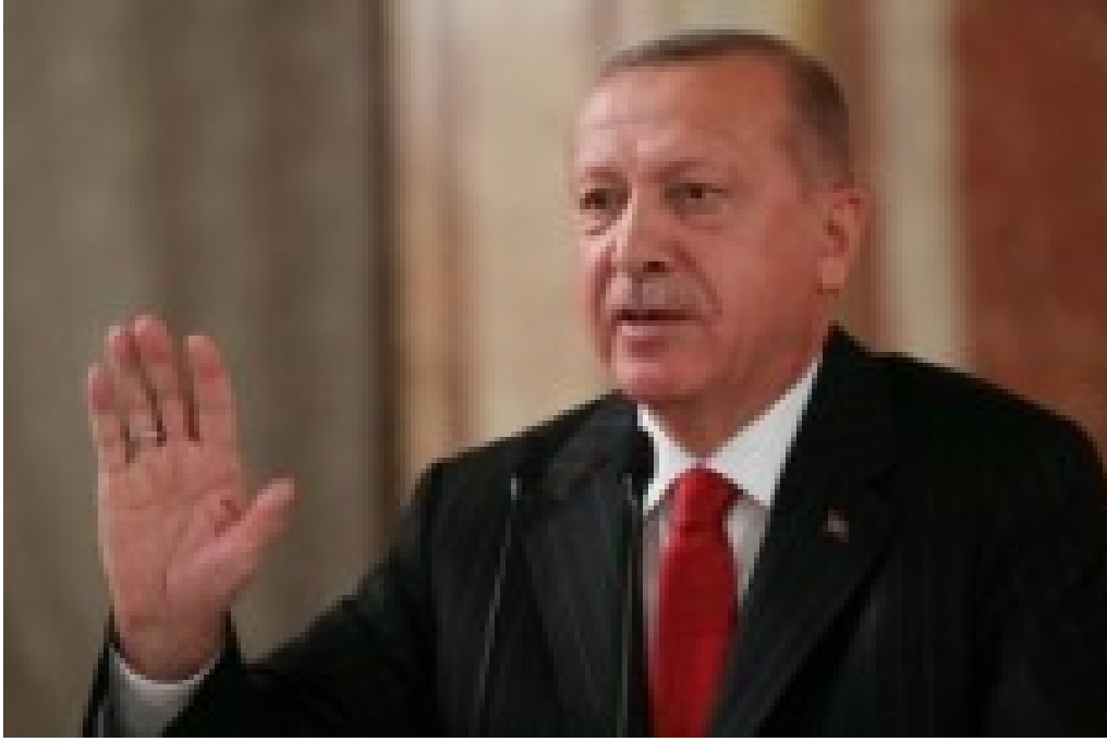
Cumhurbaşkanı Erdoğan: 'FETÖ'nün bu ülkede anlamadığı tek lider vardır o da Erbakan Hocamızdır'