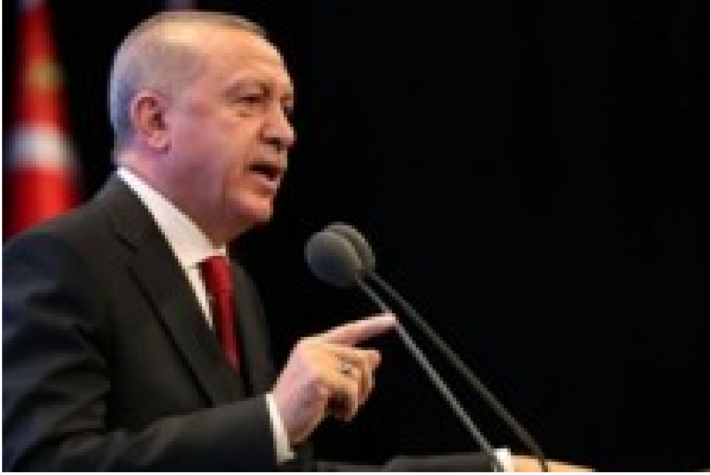
Erdoğan'dan Kılıçdaroğlu'na 'FETÖ'nün siyasi ayağı' yanıtı!