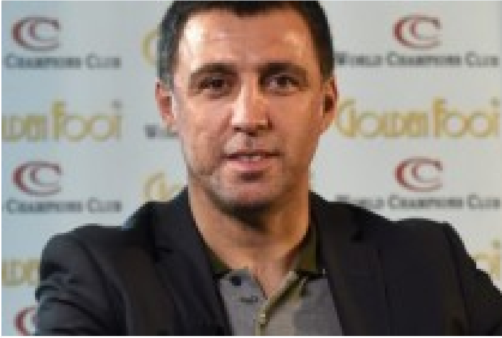
FETÖ firarisi Hakan Şükür'den flaş itiraf: Pişmanım!