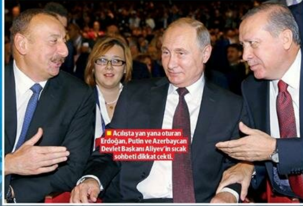
■ Acılda yan yana oturan Erdoğan, Putin ve Azerbaycan Devlet Başkanı Aliyev'in sıcak sohbeti dikkat çekti.