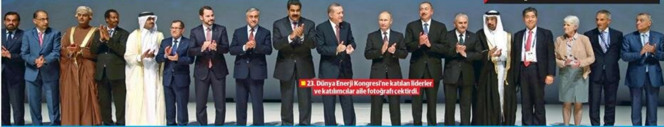
■ 23. Dünya Enerji Kongrestne katılan liderler ve katılımcılar aile fotoğrafı çekti.

● Socar Aliağa için anlaştı ● S. Arabistan nükleere geçiyor ● Afrika'nın enerjiye ihtiyacı var ● İsrail'den 6 yıl sonra ilk ziyaret