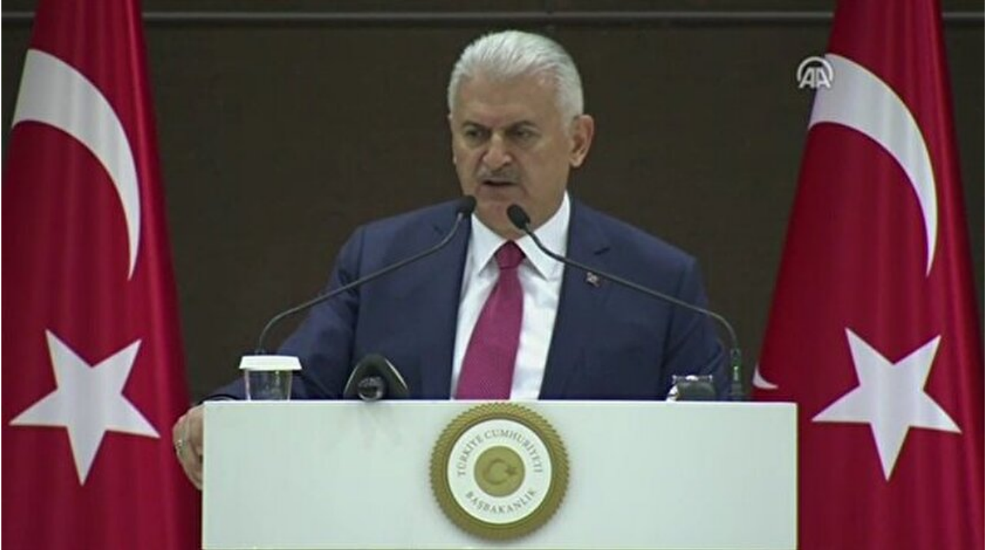
Başbakan Binali Yıldırım

Haber Merkezi · 03 Nisan 2017, 14:58 · Son Güncelleme: 03 Nisan 2017, 16:15 · Yeni Şafak