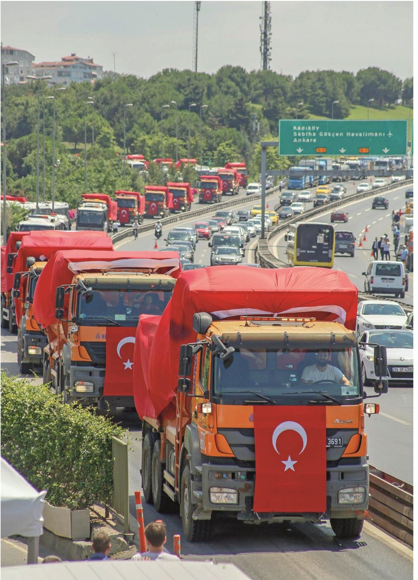
Darbe girişimi sırasında askeri araçların kışlalardan çıkışını engelleyen kamyonlar dün dev Türk bayrakları ile donatılarak 15 Temmuz Şehitler Köprüsü'nden geçiş yaptı.