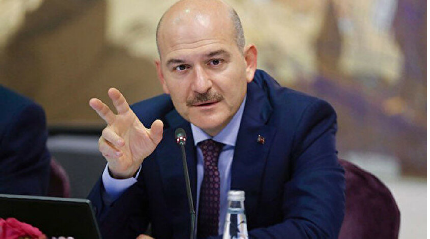
İçişleri Bakanı Süleyman Soylu