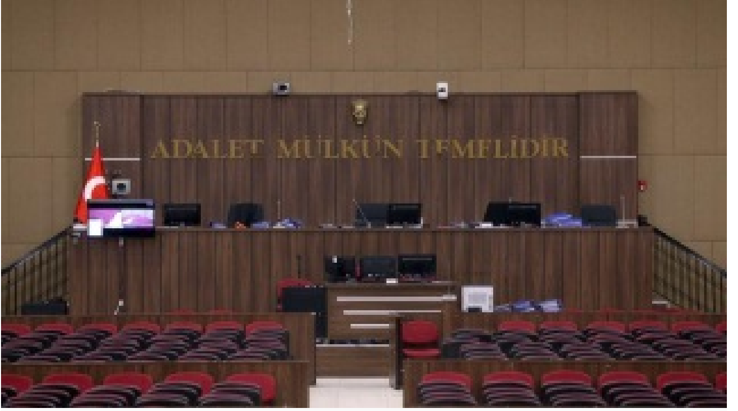
Mehmet Baransu'ya verilen hapis cezası belli oldu