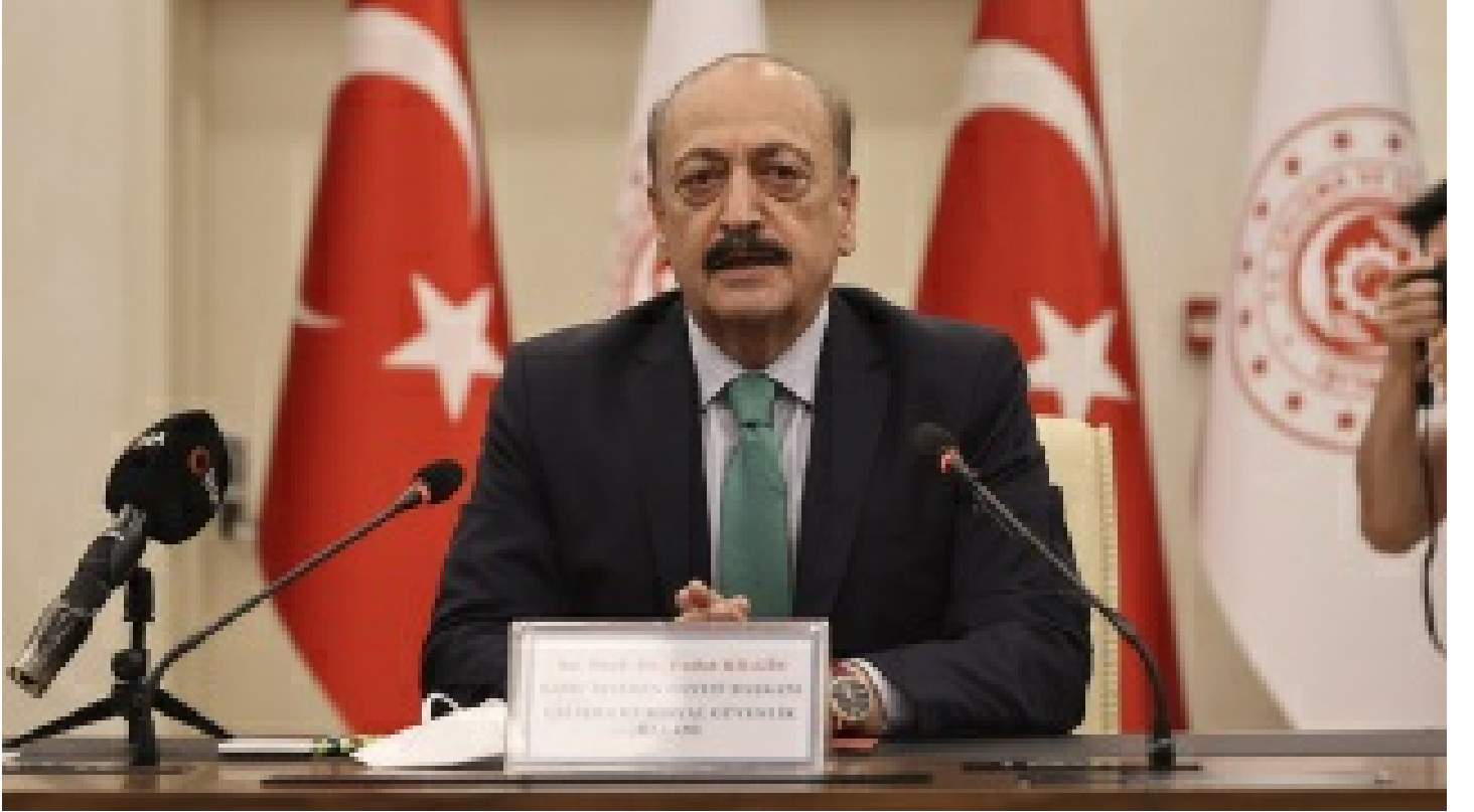
Bakan Bilgin: Türk devleti ilacın parasına bakmaz