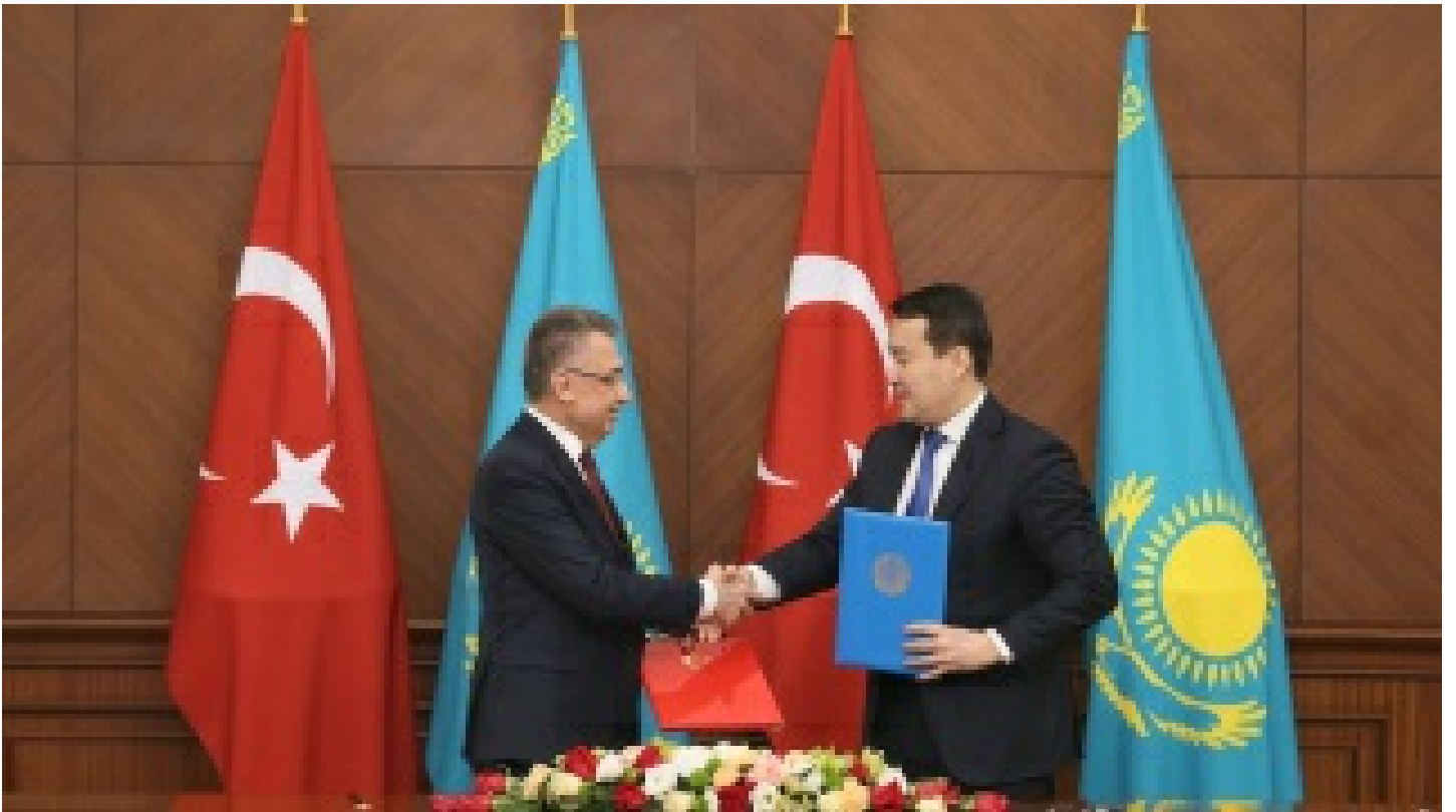
'Köklerimizden güç alarak bölgede istikrarı perinleyeceğiz'