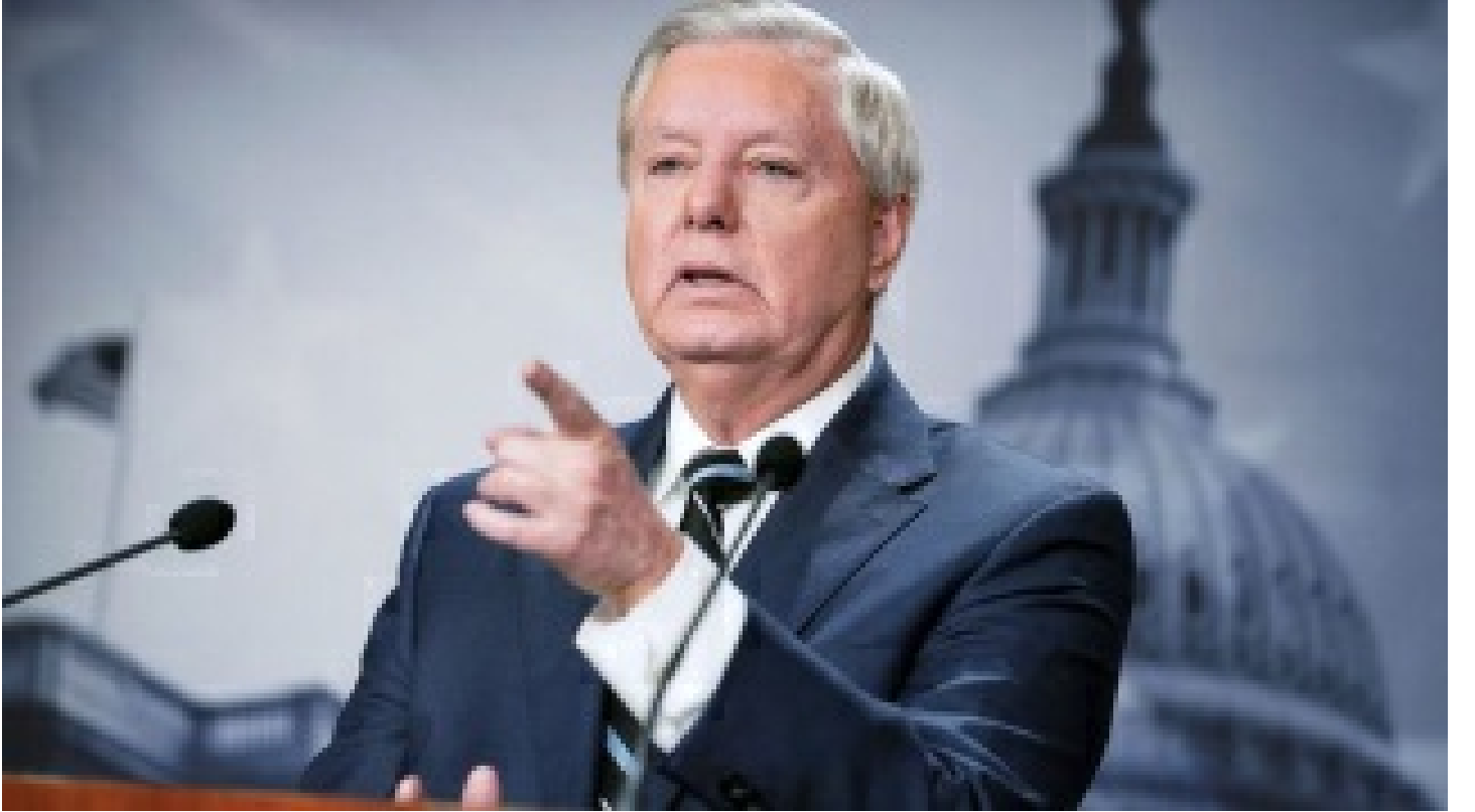
ABD'li senatörün hayali 'Putin'e suikast'