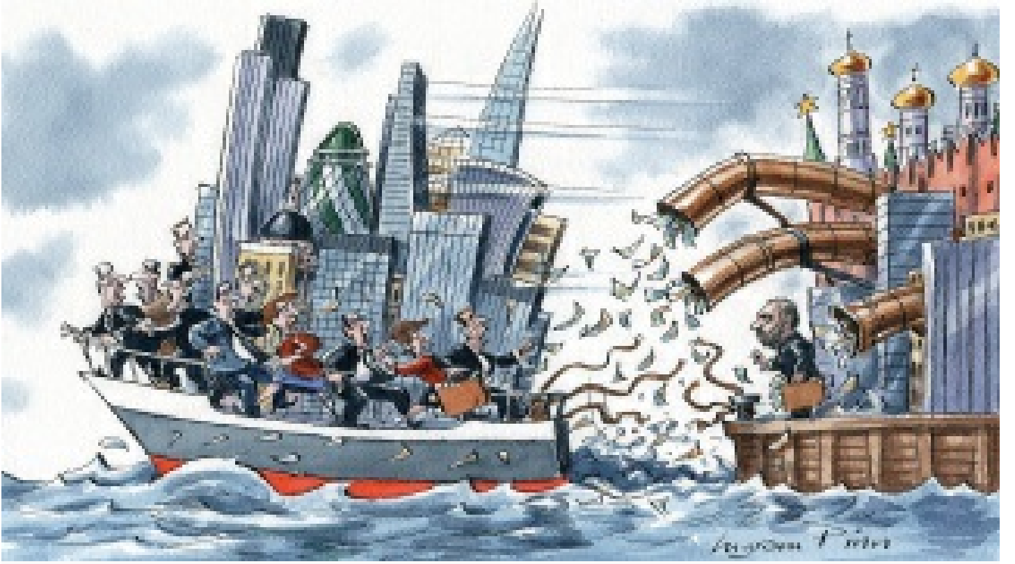
Putin'in oligarklarla mücadelesi