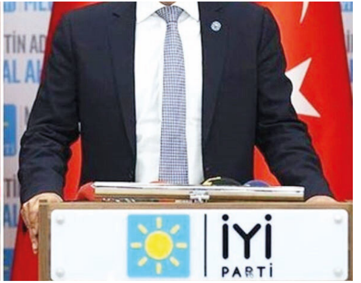
Ümit Özdağ ve Buğra Kavuncu