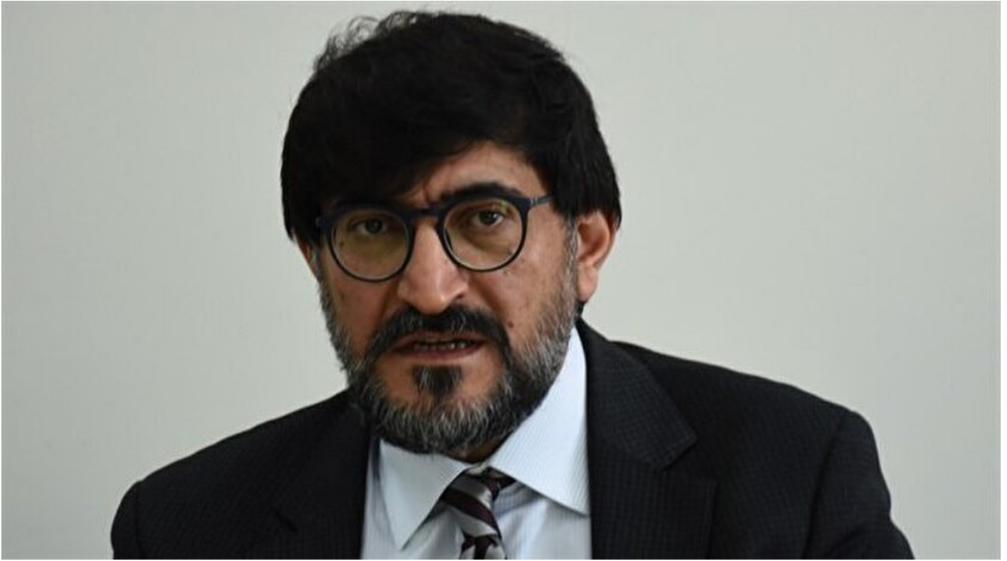
MEB Talim ve Terbiye Kurulu Başkanı Alpaslan Durmuş